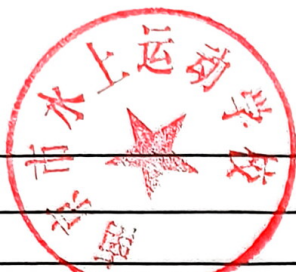
南京市市级项目预算绩效目标表